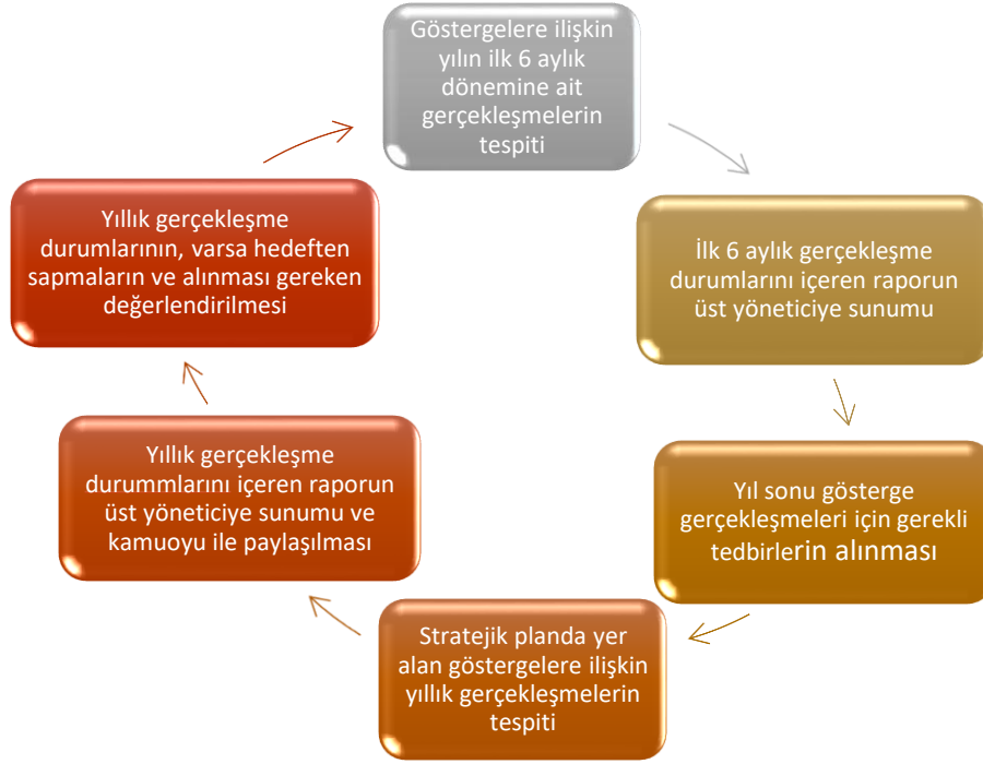
Tablo 48: Stratejik Plan İzleme Değerlendirme Süreci